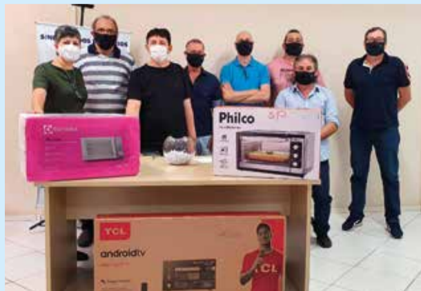
Diretores do Sindicato durante o sorteio da premiação de Natal