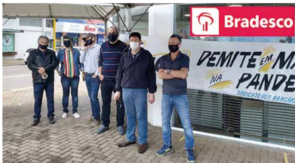
Diretores do Sindicato de Cascavel durante manifestação em frente a agências do Bradesco em Cascavel